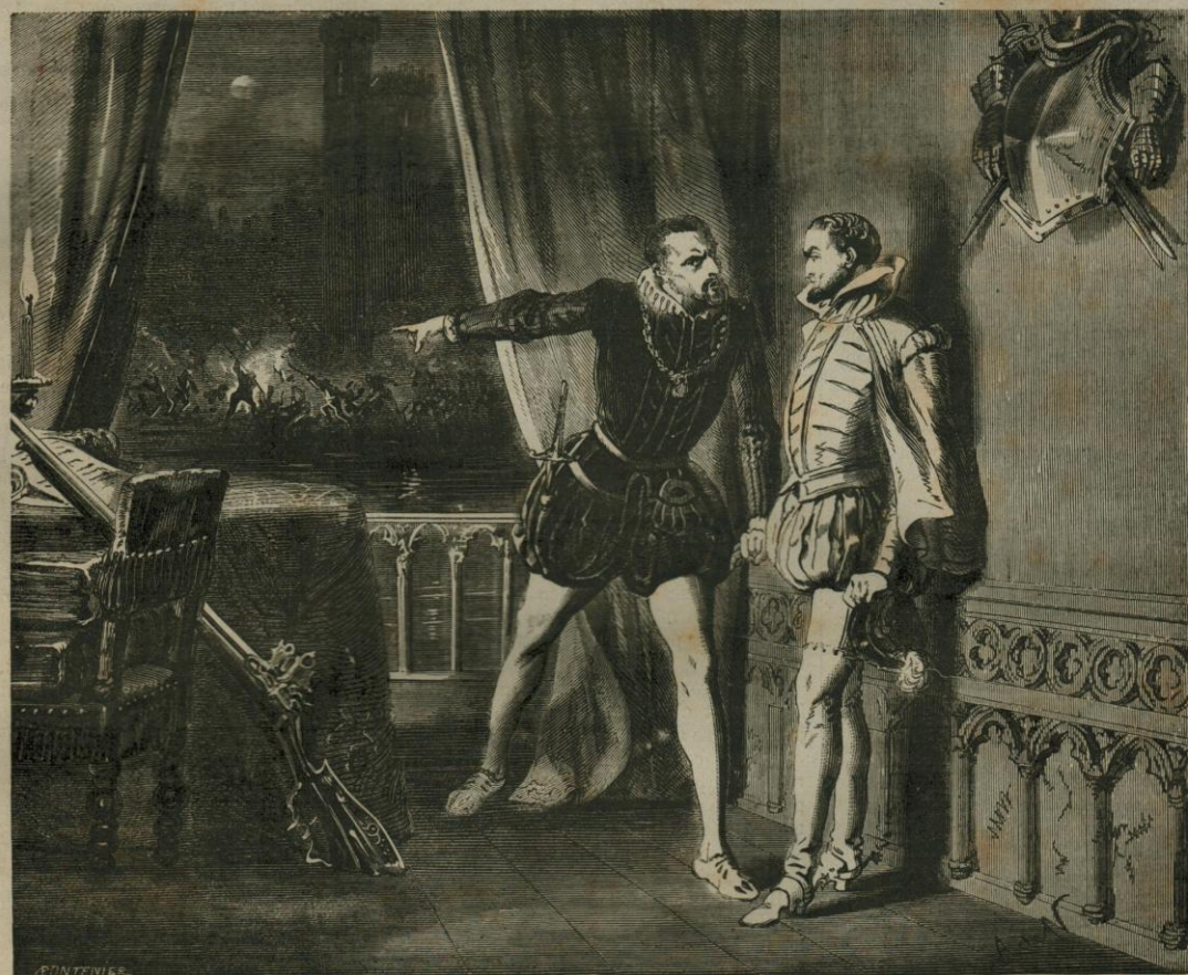
Regardez, et vous comprendrez! (Page 34.)

ABONNEMENT Un an..... 4 fr. Six mois..... 2 fr. (Un numéro par Semaine)